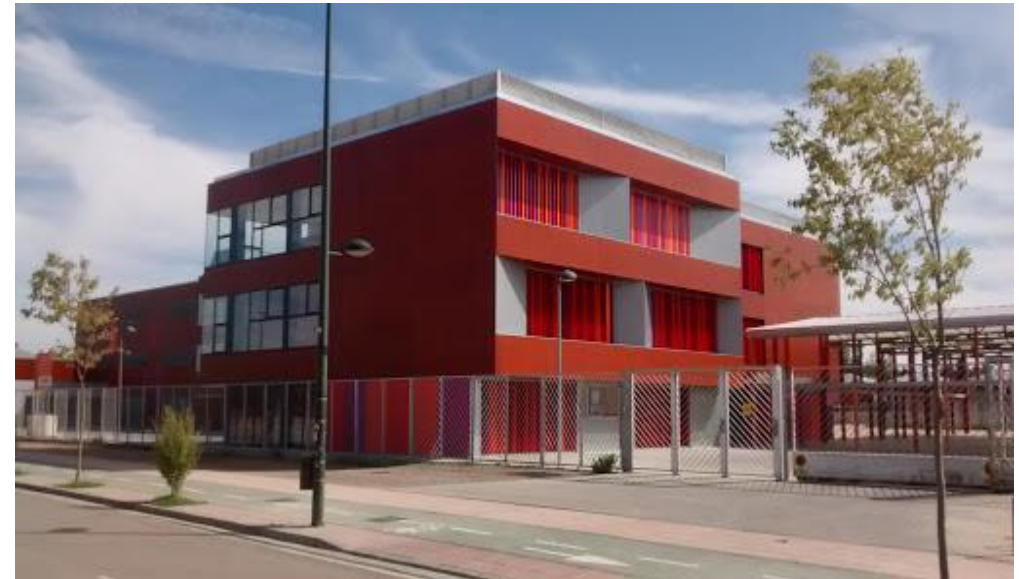
Colegio Rosales del Canal

El centro educativo en el que se va a llevar a cabo el proyecto es el Colegio Rosales del Canal situado en Calle San Juan Bautista de la Salle, 21, 50012, Zaragoza. Teléfono 876241565.